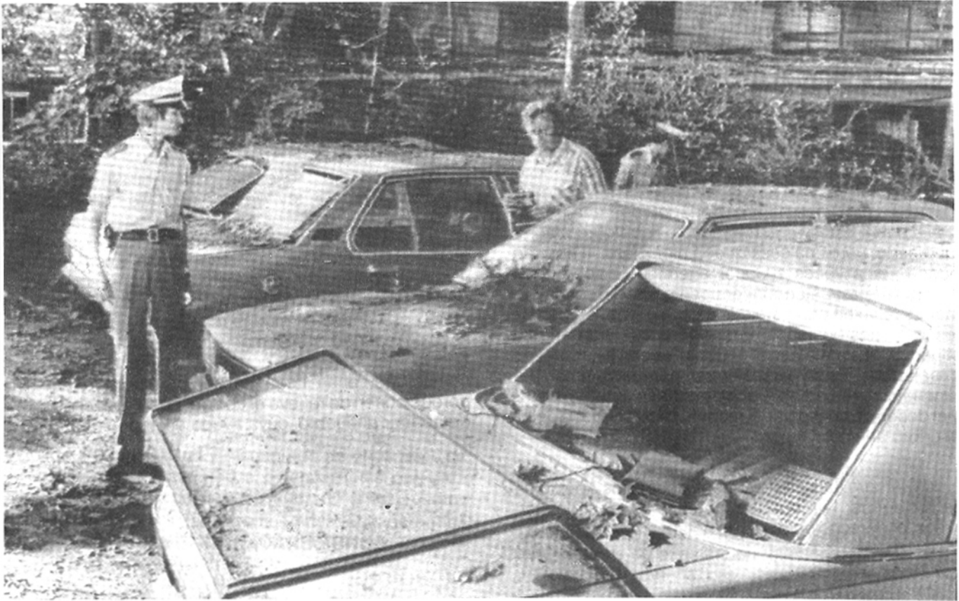
Una bomba terrorista explotó en Dusseldorf, Alemania Occidental, en agosto de 1978, dañando los automóviles oficiales del personal militar inglés radicado en esa ciudad. Desgraciadamente una mujer, víctima inocente, resultó seriamente herida.

Por esto, no hay que dormirse sobre los laureles, ni siquiera al principio. Hace dos años, en la época de las bombas postales, sugerí que la comunidad australiana estaba en un momento crucial en que tenía que decidir cuánta violencia toleraría en las campañas políticas. La desestimación es peligrosa. Las primeras bombas lanzadas en Chipre eran bombas de petróleo, mal hechas, tiradas desde las ventanas de la Oficina fiscal de Nicosia a las 4 de la tarde. Después de que pasara el efecto de la primera alarma, la gente empezó a hacer bromas sobre la elección "acertada" del blanco y a expresar abiertamente su desdén por la ejecución de las bombas. Pero la calidad de las bombas y la elección del blanco se perfeccionaron notablemente en los meses siguientes y dentro de poco una población asustada se vio poco a poco obligada a guardar silencio aun sabiendo que iban a asesinar a algún amigo. En realidad, ser asesinado resultó por sí misma una prueba de perfidia: "de seguro habrá informado". Los africanos amantes de la paz no eran un material útil para las tácticas terroristas, pero podrían ser adiestrados de tal manera para dividirlos y mantenerlos bajo terror. En América Latina encontramos ejemplos de exportación de terrorismo a países donde las condiciones internas no propician la aparición del